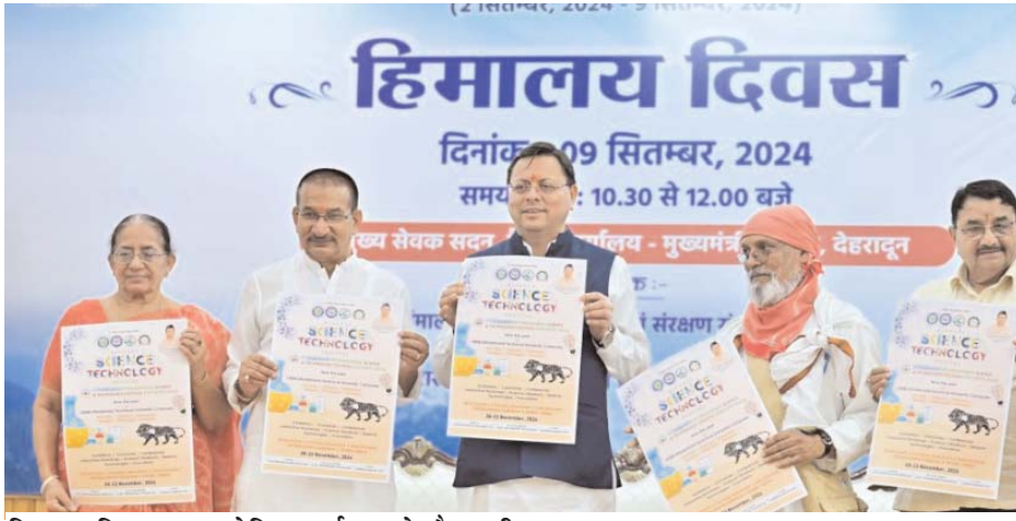
हिमालय दिवस पर आयोजित कार्यक्रम के दौरान सीएम व अन्य।

वीर अर्जुन संवाददाता देहरादून, । मुख्यमंत्री पुष्कर सिंह धामी ने सोमवार को हिमालय दिवस के अवसर पर मुख्यमंत्री आवास स्थित मुख्य सेवक सदन में आयोजित कार्यक्रम में प्रतिभाग किया। मुख्यमंत्री ने कहा कि हिमालय के सरोकारों से जुड़े विषयों के लिए महानिदेशक यूकॉस्ट दुर्गाश पंत के संयोजन में एक कमेटी बनाई जायेगी। इस अवसर पर उन्होंने यूकॉस्ट द्वारा आयोजित की जाने वाली राज्य स्तरीय पांचवें देहरादून, अन्तरराष्ट्रीय साइंस एण्ड टेक्नोलॉजी फ़ैस्टिवल के पोस्टर का विमोचन किया। यह महात्सव 06 जनपदों देहरादून, चमोली, उत्तरकाशी, टिहरी, बागेश्वर और पिथौरागढ़ स्थित इंजिनियरिंग कॉलेजों में किया जायेगा। मुख्यमंत्री ने कार्यक्रम के दौरान सभी को हिमालय दिवस की शुभकामनाएं दी और हिमालय के संरक्षण और संवर्धन के लिए कार्य कर रहे लोगों का आभार भी व्यक्त किया। उन्होंने कहा कि राज्य में